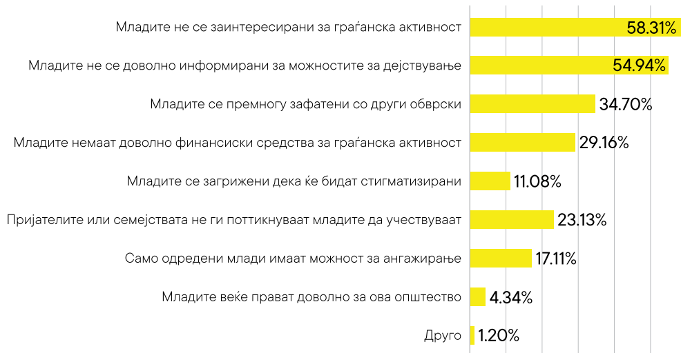
Графикон 1. Најчести причини за пасивност на младите

Покрај предложените одговори, во анализата испитаниците додале дека граѓанските организации не се доволно промовирани и доколку тие би се промовирале преку училиштата, учениците би се запознале со нивното делување и би можеле да донесат информирана одлука дали да се зачленат.