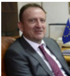
Dr. Arben Taravari